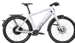
Tweede plaats STROMER ST3 Pinion