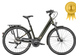
Eerste plaats MOUSTACHE Samedi 28.7 Open