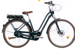
Tweede plaats ELOPS 920 E Connect LF