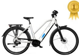
Eerste plaats STELLA Morena MDB3 FI