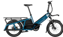
Derde plaats Riese & Müller Multitinker vario