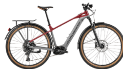
Tweede plaats MONDRAKER Prime RX