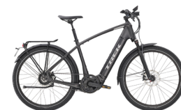
Derde plaats TREK Allant+ 9S