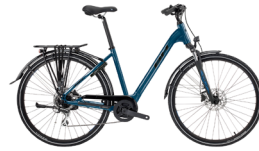
Derde plaats BH Core City Wave