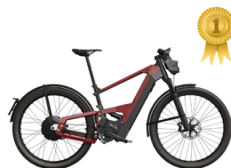
Eerste plaats ÅSKA Supercommuter